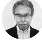
武田前社長は会長就任

「ザ」の下げ期待が強まる。しかし、菜種相場については確実とみられる高値推移や円安、さらには大豆相場に左右されない付加価値化の取組など、なお一層のコストに見合った適正価格での販売が求められる。