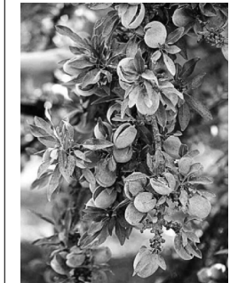
皮の色づくると収穫の目安 皮が色づくると収穫の目安。アーモンドの生果手は、比較的小さいとい

米カリフォルニア州の中部に位置し、南北約800kmにわたるセントラル・バレー。米国内でも最も農業が盛んなエリアの一つ。中でも地中海性の気候を利用したアーモンドの栽培は全米生産量のすべてを担い、世界のアーモンド生産の実に8割を占める一大産業だ。