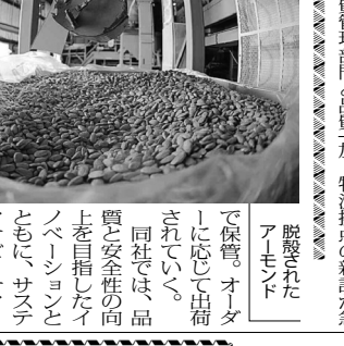
脱粒されたアーモンド

「1980年に私を含め、100軒と言えは長期が少い品種も南の半分は加工用である。アーモンドは、90年代にかけて、バレーに位置する。この地で家族経営のアーモンド農園として創業し、現在の年間生産量は3千500万ポンド(約1万6千ト)以上だ。現在、自給は100万ポンド程度で、それ以上は輸出している。主にアメリカとヨーロッパの大手スーパーマーケットの店頭で売られている。