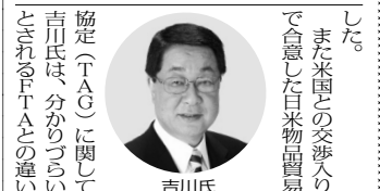
農水相に吉川氏 閣内閣定 農水相に吉川氏