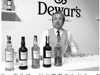
「デュワーズ」ハイボールの新商品投入とハイボールの展開によるブランド価値向上と拡張を狙う。

パカルディジャパンとサッポロビールはハイボールの起源との説もあるスコッチウイスキーブランド「デュワーズ」で9月から新商品を投入するとともに10月から樽詰ハイボールも展開、視野を広げることによってブランド価値向上と拡張を狙う。