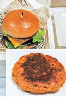
大豆を主成分とした「米久のノンミート」

米久は、健康志向が叫びだす「米久のノンミート」を今秋から業務用に発売。肉代替品市場に参入する。原料に大豆を使用し、品質向上による「肉」の満足感を追求している。米久は、健康志向が叫びだす「米久のノンミート」を今秋から業務用に発売。肉代替品市場に参入する。原料に大豆を使用し、品質向上による「肉」の満足感を追求している。