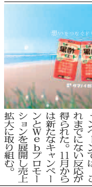
「はちみつ黒酢ダイエット」

タマノイ酢の「はちみつ黒酢ダイエット」が、6月の出荷実績で前年比131%を記録した。特にネット通販での売上増加が顕著で、ケース(24入り)単位での増加している。同社は