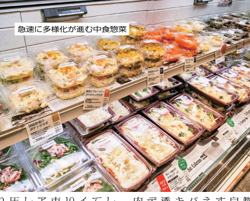
急速に多様化が進む中食惣菜

中食惣菜市場は右肩上がり成長を遂げている。2018年の惣菜市場は9年連続で拡大。市場規模は10兆2千500億円を超えた。核家族化と単身世帯の増加、女性の社会進出、少子化・高齢化が進んでおり、食卓にフラスコを注ぎながら手軽に食べられる惣菜の需要は引き続き高まると予測されている。さらには10月からの消費税増税が、軽減税率の対象となる中食惣菜の需要を押し上げることも考えられている。