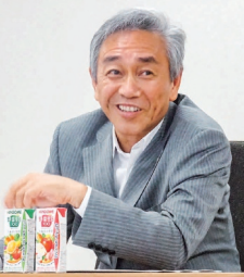
カゴメの寺田直行社長

カゴメの寺田直行社長は、2022年からの中期経営計画において「コトビビジネス」を事業化する考えを示した。同社は、今年度から始まった第2次中期経営計画(2019~2022年)において、収益力強化の観点から新事業・新領域への挑戦による成長を目指す。コトビビジネスは、新事業の一環として第3次中期において大きな柱に