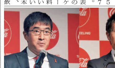
「コカ・コーラ」の代表取締役社長と副社長

「コカ・コーラ」は、店頭で新しく、徒歩や自転車による容器サイズの価値を伝えるという狙いがある。