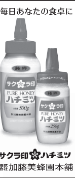
毎日あなたの食卓に

発行所 食品新聞社 http://www.shokuhin.net/ 大阪市北区西天満5-10-17 電話 06(6361)4972 東京 都営区大塚1-1-8 電話 03(3552)3756-4031 名古屋 市中区丸の内2-10-11 電話 052(221)5319 支店 広島・福岡 ©食品新聞社 2019 THE JAPAN FOOD NEWS 創刊 1947年