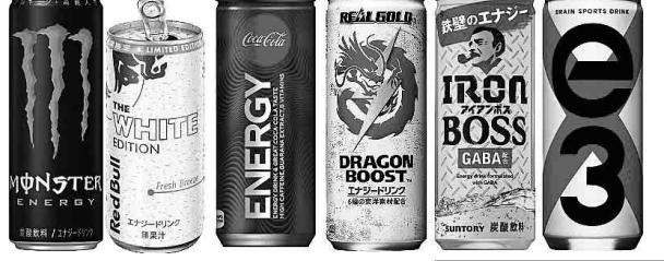
(左から)「モンスターエナジー」(355ml)、「レッドブル・エナジードリンク ホワイトエディション」(185ml)、「コカ・コーラ エナジー」(250ml)、「リアルゴールド ドラゴンブースト」(250ml)、「サントリー アイアンボス」(250ml)、「e3 (イースリー)」(240ml)

ストレスフルな世相を反映してエナジードリンクが活性化している。エナジードリンクは、スポーツ・音楽・文化活動への協賛で盛り上げてきたブランドの世界観で若者を惹きつけている。