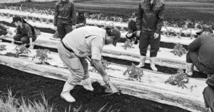
東日本大震災から丸9年を前に控え、カゴメは、東北復興支援活動の一環として、産業界と連携し、被災地復興支援活動を行っている。

被災地復興へ「産業界」... 成成さまさままなほの授業を行った。その活動展開... 「産業界」に力をつけた「加工」を