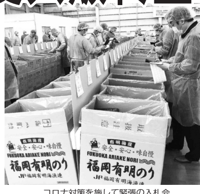
コロナ対策を施して緊張の入札会

海苔2019年度共販終盤 今年度(2019年11月~2020年4月)の海苔共販が最終盤に入った。各産地で残り1、2回の入札会を残すのみで最終共販枚数は68~69億枚と予想されている。前年に続く暖冬の中、なんとか前年実績(大凶作63.7億枚)を上回る見込みだが、相場は開始から高値続き。一気に在庫不足を解消するほどの共販量でもなく、一昨年の平成以降の平均最高値(13円07銭最終)を上回る推移(13円68銭)となっている。