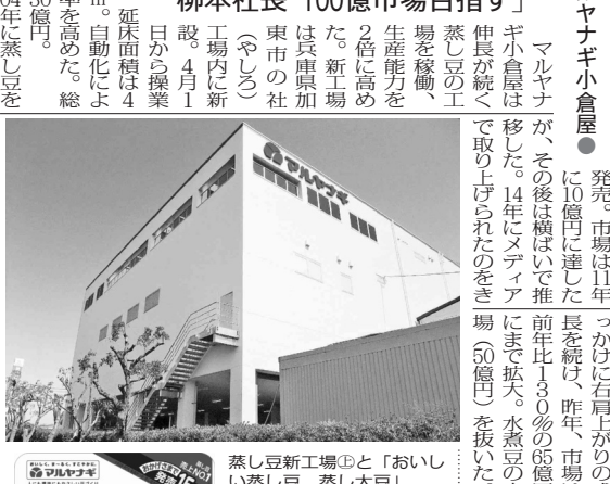
蒸し豆新工場と「おいしい蒸し豆」

柳本社社長「100億市場目指す」 蒸し豆の新工場、生産力倍増へ。柳本社社長「100億市場目指す」。蒸し豆の新工場、生産力倍増へ。柳本社社長「100億市場目指す」。